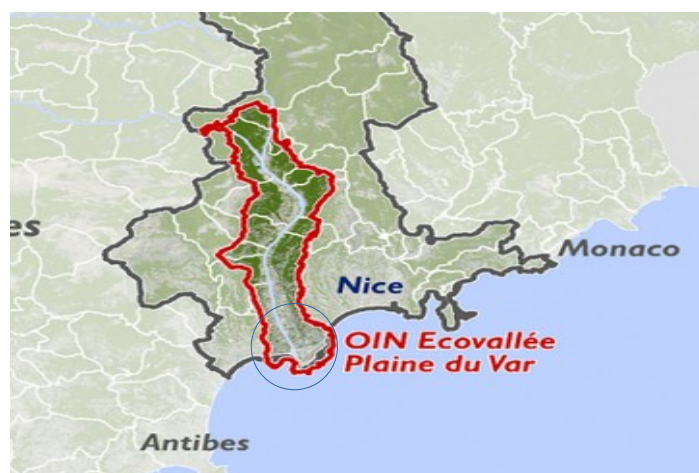
Figure 1: localisation du secteur de projet périmètre MNCA (ligne bleue) ; périmètre OIN (ligne rouge) et secteur de projet (cercle bleu)

La métropole Nice Côte d'Azur (MNCA), située dans le département des Alpes-Maritimes, regroupe 51 communes et 553 305 habitants (2020), sur une superficie de 1 479,73 km 2 . Son territoire est couvert par le plan local d'urbanisme métropolitain (PLUm) approuvé le 25 octobre 2019. Le schéma de cohérence territoriale (SCoT) de Nice Côte d'Azur (prescrit le 13 novembre 2013) 1 est en cours d'élaboration.