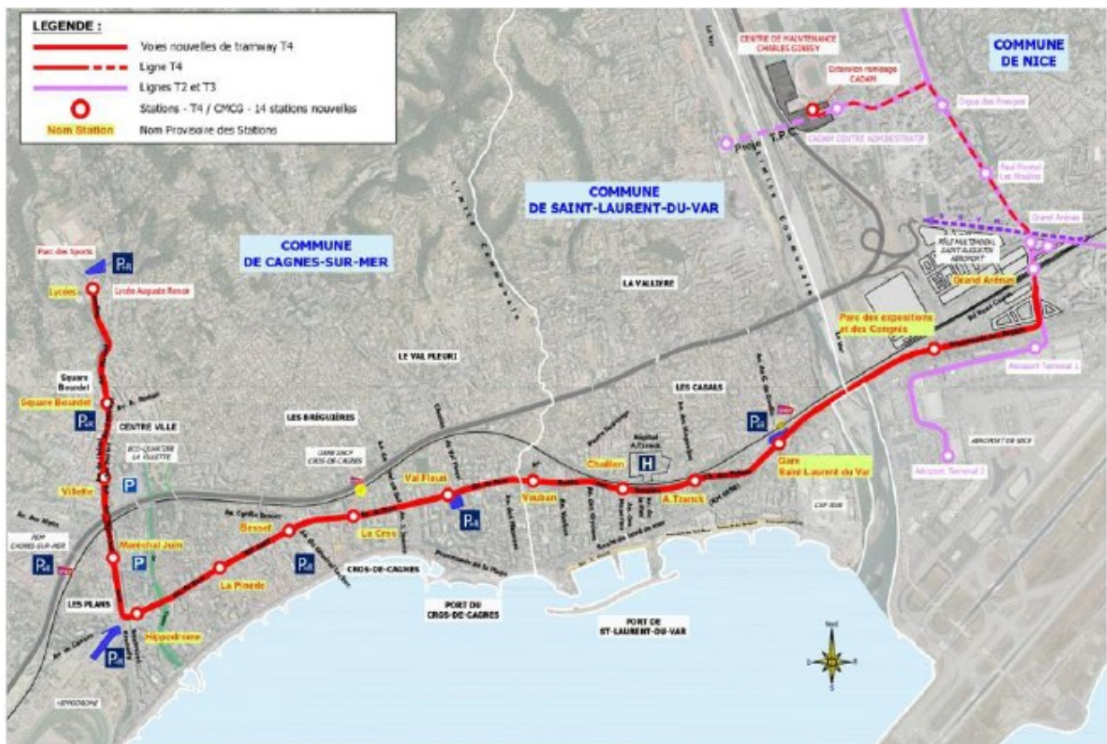
Figure 3: tracé de la ligne 4 du tramway (en rouge sur le plan) - Source dossier.

Aucun dispositif aérien (de type caténaire) n'est nécessaire pour l'alimentation électrique des rames qui disposent de leur propre « ressource énergétique embarquée » avec rechargement par le sol au niveau des stations. La ligne 4 comporte deux voies de circulation en site propre sur l'emprise de la voirie existante (essentiellement l'avenue du Maréchal Juin et la RM 6007 ex RN7). Le tracé est découpé en quatre secteurs 5 , eux-mêmes subdivisés en tronçons inter-stations.